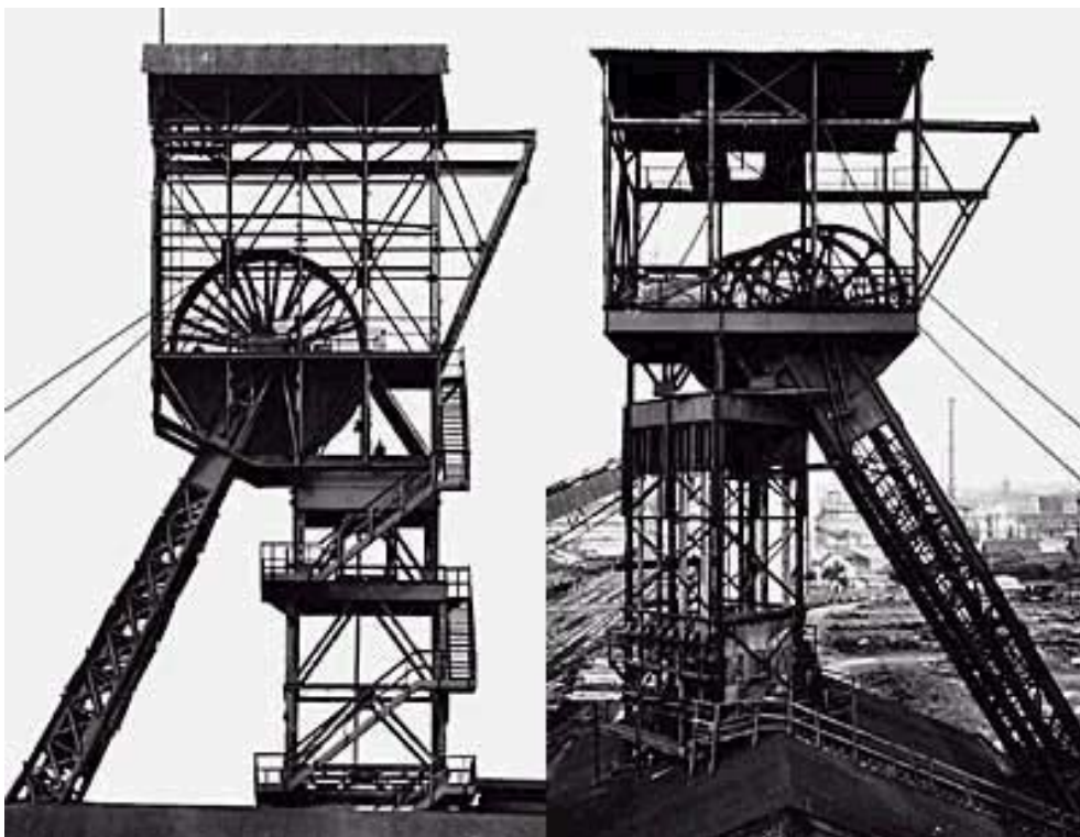
Zechen in Essen (1981) und Bochum (1973).