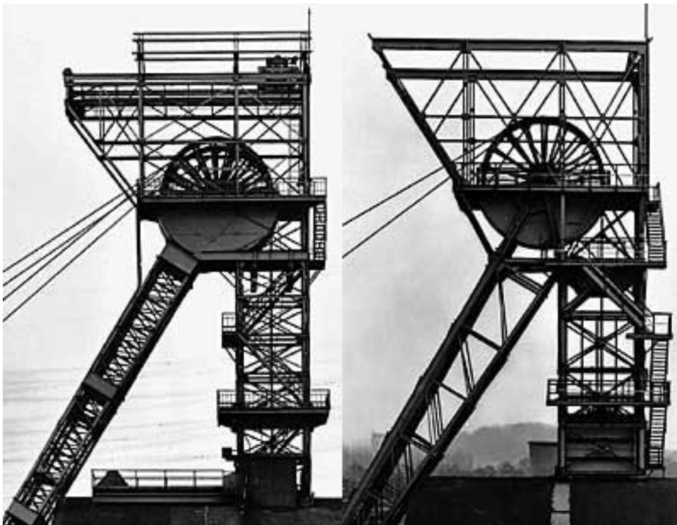
Zechen in Wanne-Eickel und Waltrop (1982).