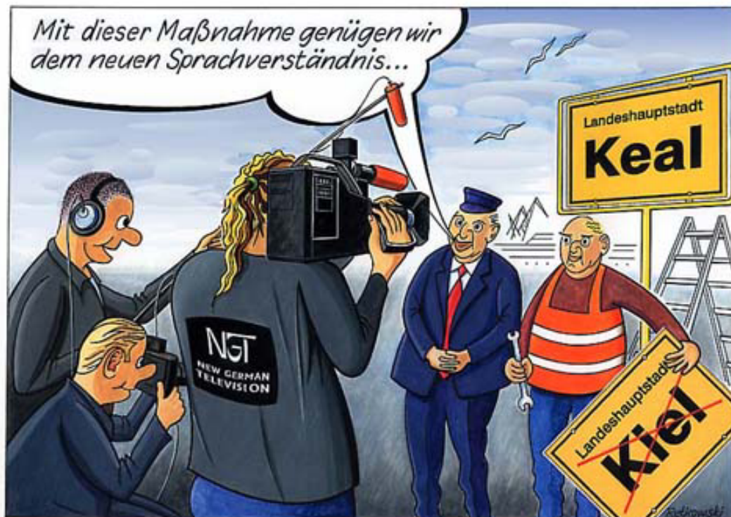
- Konsequenzen -