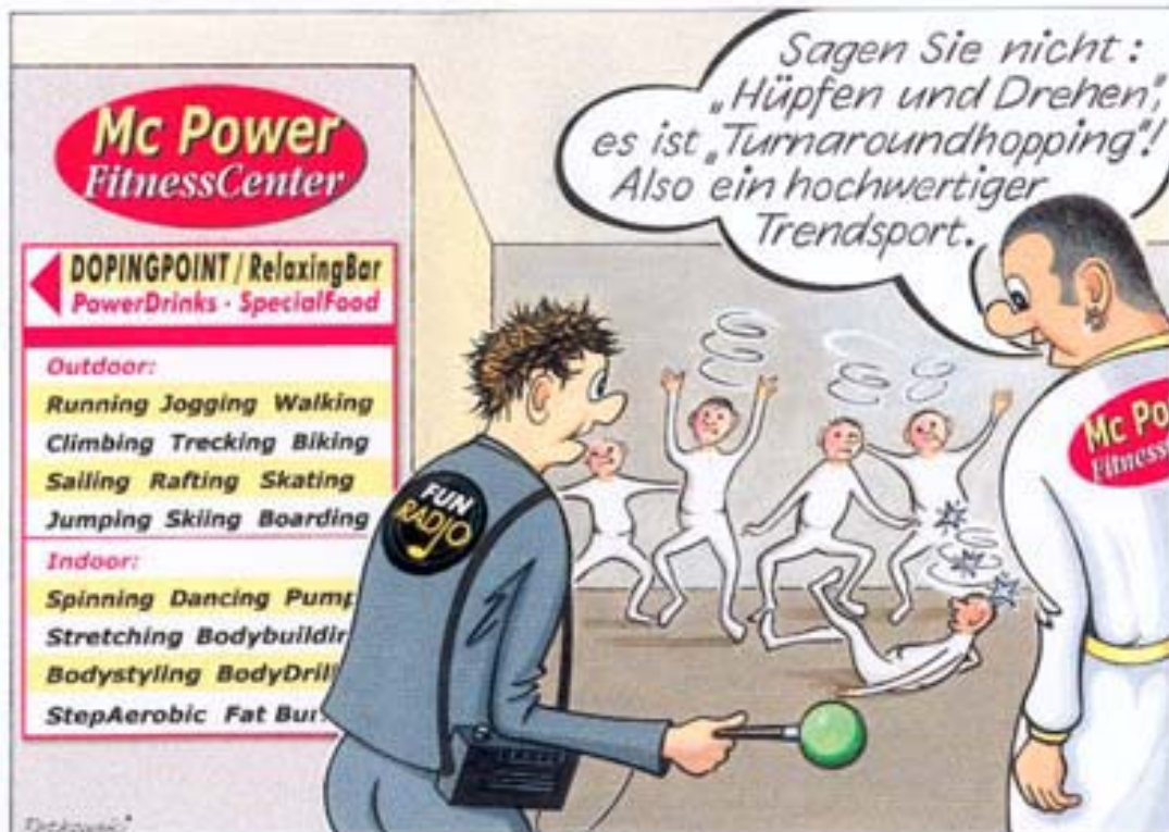
- Freizeit (Sporting, Turning, Gymnasting) -