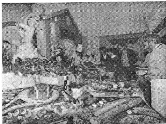
Daviscup – oder das „große Fressen“ der VIP's.

bänden geben. DTB-Präsident Stauder lud das Präsidium des DDR-Verbandes zur ersten Daviscup-Runde 1990 nach Bremen ein und wird 50 Karten für das Match Deutschland – Holland überreichen. An materielle Hilfe soll es nicht fehlen, jedoch muß eine organisatorische Lösung gefunden werden. Die DDR-Vertreter wollen nicht als Bittsteller dastehen.