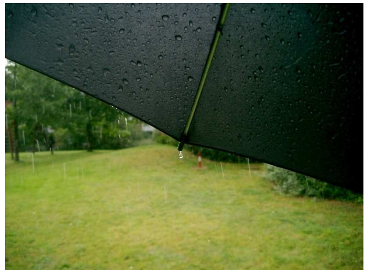
Photo B: gelungen, weil Entfernungseinstellung auf den herabfallenden Tropfen eingestellt ist (motivische Konzentration), Verschlusszeit etwas länger, daher im Hintergrund etwas überbelichtet, Schirm steht tiefer, man „duckt“ sich förmlich vor dem Regen (...)

Photo A: gelungen, weil Regentropfen gut eingefangen, kurze Verschlusszeit, aber Entfernungseinstellung versehentlich auf Hintergrund (...)