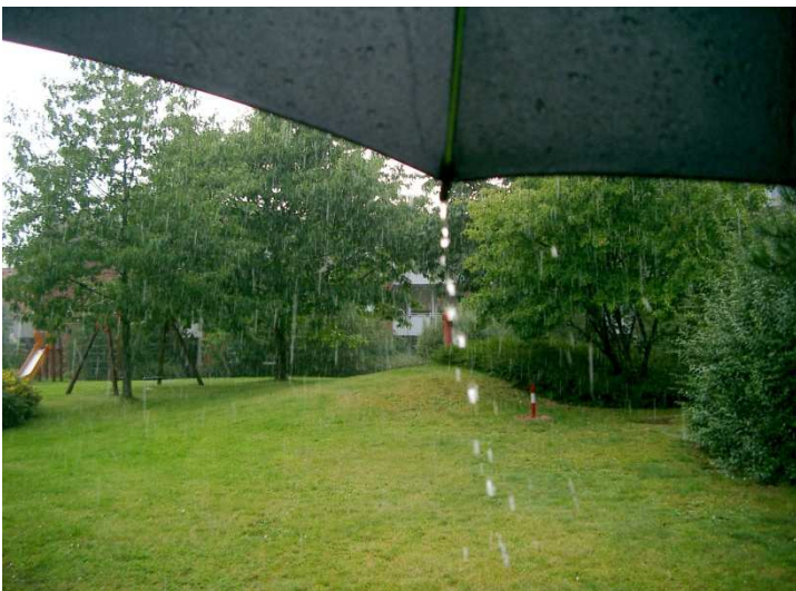
Photo A: gelungen, weil Regentropfen gut eingefangen, kurze Verschlusszeit, aber Entfernungseinstellung versehentlich auf Hintergrund (...)

Ein Fotograf hat die beiden folgenden Fotos im Regen angefertigt (siehe auch die farbige Projektion). Entscheide, welches Bild du für gelungener hältst. Argumentiere dabei hauptsächlich in Richtung der Aufnahmetechnik! = 7 P