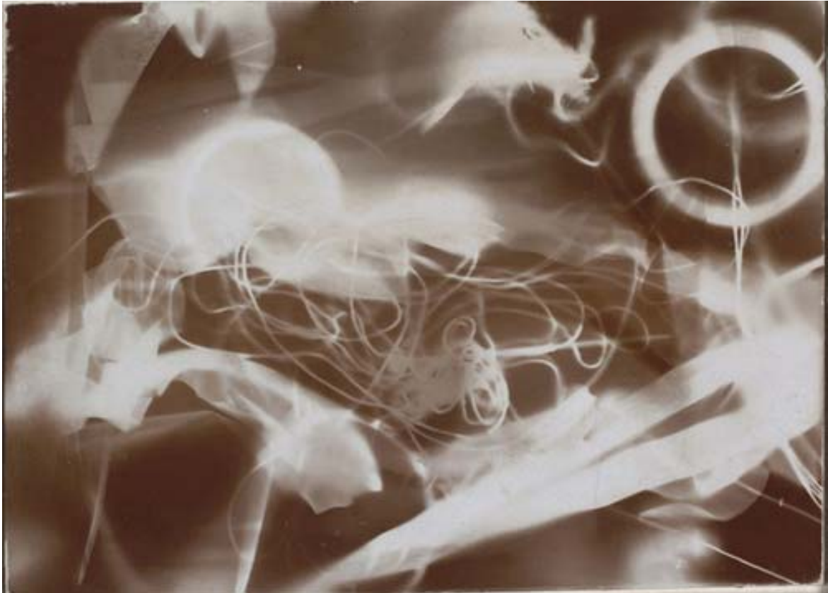
Christian Schad: Fotogramm. 18 x 24 cm. 1920.

Der deutsche Fotogrammkünstler Christian Schad lebte von 1894 bis 1982. Seine ersten Fotogramme entstanden ab 1918. Er nannte sie „Schadographien“, weil er der Meinung war, das Verfahren des Fotogramms selbst neu entdeckt zu haben.