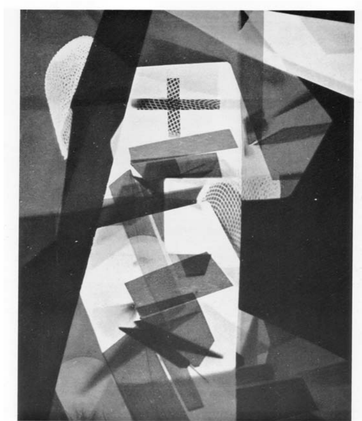
Moholy-Nagy: Fotogramm. 18 x 13 cm. 1922 / 1923.

Der ungarisch-amerikanische Fotogrammkünstler László Moholy-Nagy lebte von 1895 bis 1946. Seine ersten Fotogramme entstanden ab 1922. Ihm wird die Prägung des Begriffs „Fotogramm“ zugeschrieben, obwohl auch andere Künstler (z.B. Man Ray oder Christian Schad) der Meinung waren, dieses Verfahren entdeckt zu haben. Moholy-Nagy verfolgte eine systematische und durchdachte Komposition in seinen Arbeiten. Am meisten reizten ihn interessante Wirkungen zwischen hellen und dunklen Bereichen und die Qualitäten von Transparenz und Dichte.